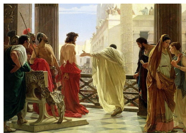
Ecce Homo by Antonio Ciseri

Como romano, Pilato no tenía ninguna razón para afirmar a Jesús. El ministerio de Jesús estaba complicando su mantenimiento de la paz en Judea, colocándolo torpemente entre la jerarquía judía local y el César. Mientras que el primero quería que Pilato ejecutara a Jesús (ya que era ilegal que lo hicieran), el segundo no toleraría a un rey de los judíos que no fuera un títere que Roma podía controlar. De ahí la acusación del Consejo Judío de que Jesús había socavado la autoridad de César y afirmó ser rey (Lucas 23: 1-2).